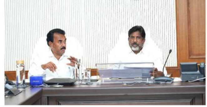
జూన్ 7 న్యూస్ హైదరాబాద్

మన ఊరి న్యూస్ జూన్ 7: రాష్ట్రంలో ఆదాయం పెంచే మార్గాలు అన్వేషించాలని డిప్యూటీ సీఎం భట్టి విక్రమార్కు మల్లు అధికారులను ఆదేశించారు. శుక్రవారం సచివాలయంలో వివిధ శాఖల సమీక్ష సమావేశం నిర్వహించారు. ప్రధానంగా ఆర్థిక, రెవెన్యూ, ఎక్సైజ్, రవాణా, ఆరోగ్య శాఖల పనితీరును సమీక్షించారు. సమావేశంలో రెవెన్యూ శాఖ మంత్రి పొంగులేటి శ్రీనివాస్ రెడ్డి, ఎక్సైజ్ శాఖ మంత్రి జూపల్లి కృష్ణారావు, రవాణా శాఖ మంత్రి పొన్నం ప్రభాకర్ తదితరులు పాల్గొన్నారు. సమీక్షలో భాగంగా గత రెండు ఆర్థిక సంవత్సరాల ప్రగతిని సమీక్షించారు. ఆ తర్వాత బడ్జెట్ అంచనాలకు అనుగుణంగా ఈ ఆర్థిక సంవత్సరంలోని మొదటి రెండు నెలలు కనబరిచిన పనితీరును సమీక్షించి ఆయా శాఖల్లో పనితీరు మెరుగుపరచుకోవడానికి యంత్రాంగాన్ని సిద్ధం చేసుకుని ఏటవంటి లీకేజీలు లేకుండా తగిన జాగ్రత్తలు తీసుకోవాలని అన్ని శాఖల అధికారులను ఆదేశించారు. ఎన్సీసీ మెంట్ విభాగాన్ని పటిష్టపరిచి బడ్జెట్ అంచనాలను అందుకోవాలని వివరించారు. ఆదాయం పెంచుకునేందుకు వాణిజ్య పన్నుల శాఖలో వేసిన కమిటీ పనితీరును డిప్యూటీ సీఎం అడిగి తెలుసుకున్నారు. ఆదాయం పెంచుకునేందుకు కమర్షియల్ ట్యాక్స్ విభాగాల్లో తరచూ సమీక్ష సమావేశాలు నిర్వహించాలని సూచించారు. ఆర్డీసీ ప్రస్తుతం వివిధ బ్యాంకులు, సంస్థలకు చెల్లిస్తున్న రుణాల వడ్డీ రేటును సమీక్ష చేసుకొని, తక్కువ వడ్డీ రేటు ఇచ్చే సంస్థలకు రుణాలను బదలాయించు చేసుకుని ఆదాయం పెంచుకునే మార్గాలు అన్వేషించాలని డిప్యూటీ సీఎం ఆదేశించారు. ఇటీవల సింగరేణిలో చేసిన ఈ ప్రయోగం ద్వారా వందల కోట్ల ప్రయోజనం